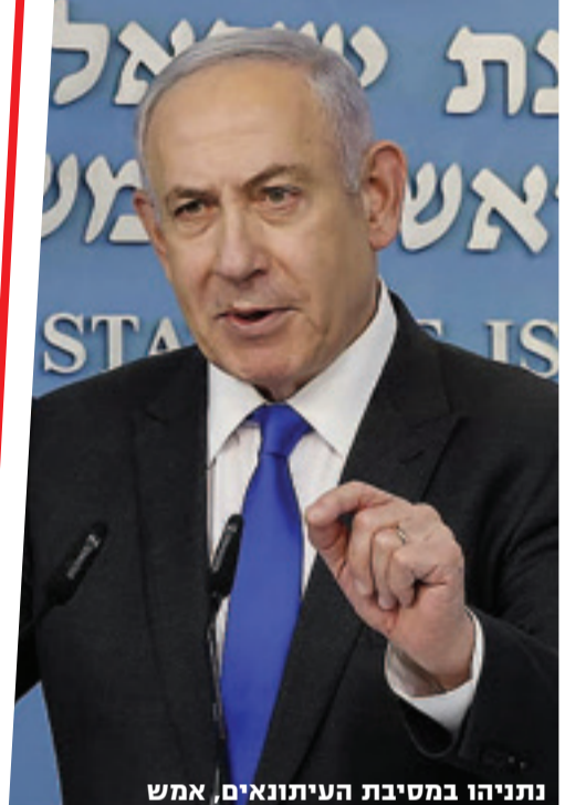
נתניהו במסיבת העיתונאים, אמש