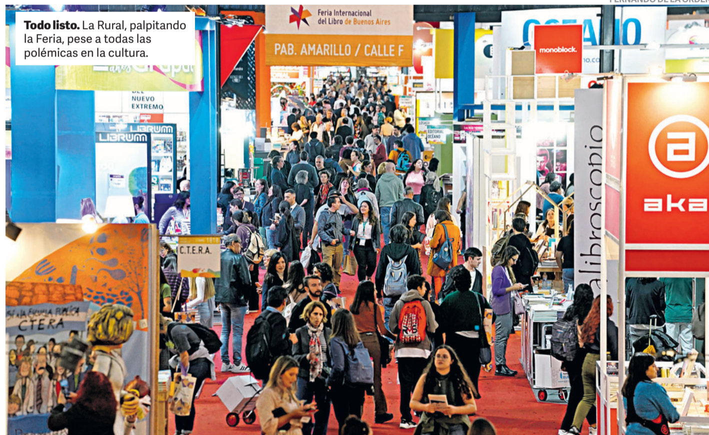
Todo listo. La Rural, palpitando la Feria, pese a todas las polémicas en la cultura.